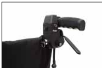
Guida ergonomica a leva