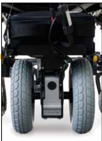
Doppia ruota per maggiore trazione e stabilità