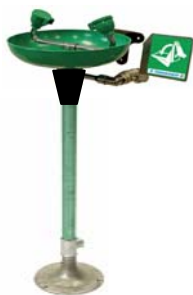
Immagine puramente illustrativa, per caratteristiche e dettagli leggere quanto riportato nella scheda tecnica.

FAMIGLIA PRODOTTO: LAVACCHI E DOCCE D'EMERGENZA