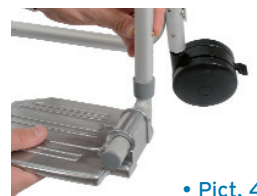
• Pict. 4

The footrest of shower chair can be adjusted according to various requirements. You have to push the locking clip on the footrest ( Picture 4 ) not less than 6.5cm distant from the floor. Check that both footrest are adjusted at the same height.