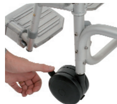
• Pict. 5

The lever on the brake must tighten the wheel. In case of necessity check the pressure of the casters. If necessary adjust the loosen nut and then tighten up the nut.