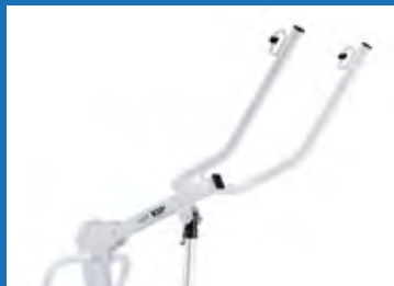
Braccio di verticalizzazione dritto. Straight hoisting arm.