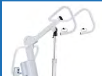
Braccio di verticalizzazione curvo. Curved hoisting arm.