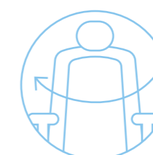
Sedile girevole Swivel seat