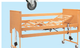
Altezza da terra regolabile da 40 a 80 cm.