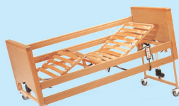
Possibilità Trendelenburg (12°) anti-Trendelenburg (12°)