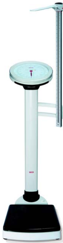
Altimetro seca 224 (montato sulla bilancia seca 756)