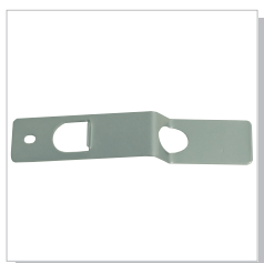
Blocco direzionale per ruote anteriori (pa)