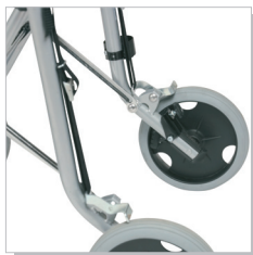
Freno a strascico