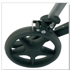
Dispositivo frenante ruote posteriori (pa)